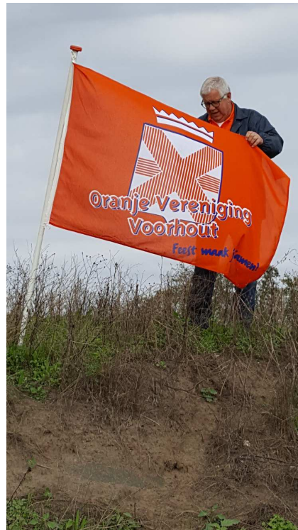
Lossing van de Oranjevlucht duiven