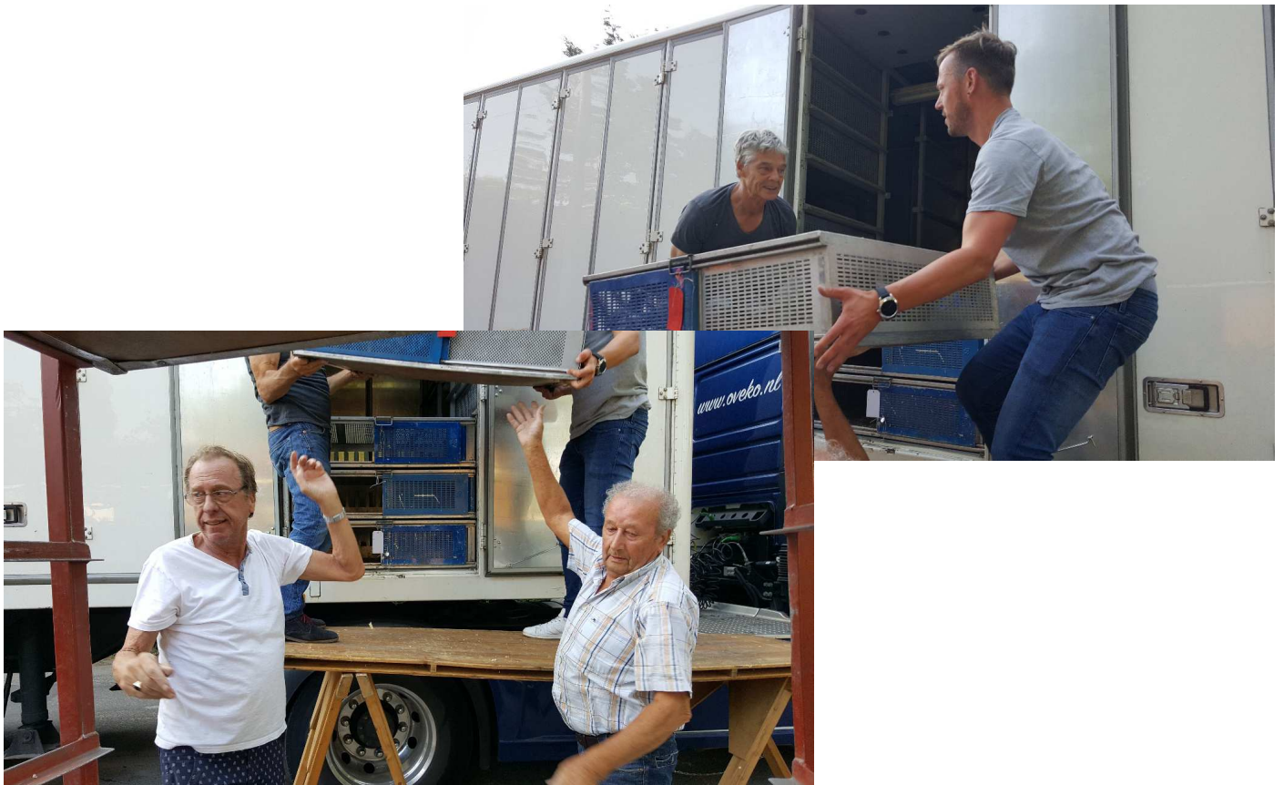
De laadploeg in actie !